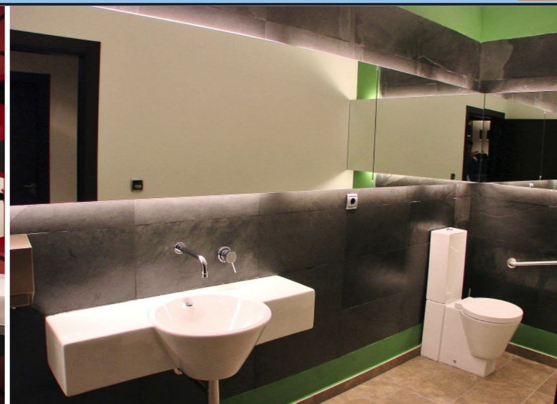
© Cortina: Ébano, Arquitectura de Interiores.