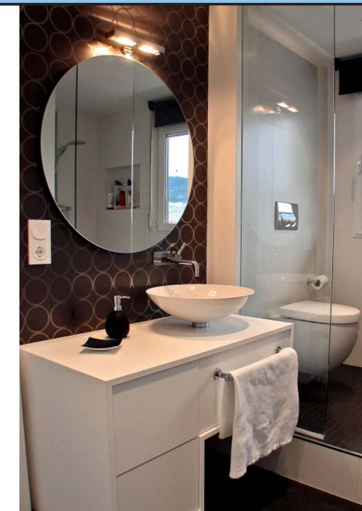
> Los espejos y cancelas transparentes generan mayor amplitud.

Adaptar los lavamanos sobre una base es también una constante que proporciona mayor elegancia.