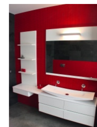
> El rojo rompe con el espacio clásico y proporciona un aspecto moderno.

A partir de materiales que contrasten entre sí se pueden proponer espacios modernos y cómodos