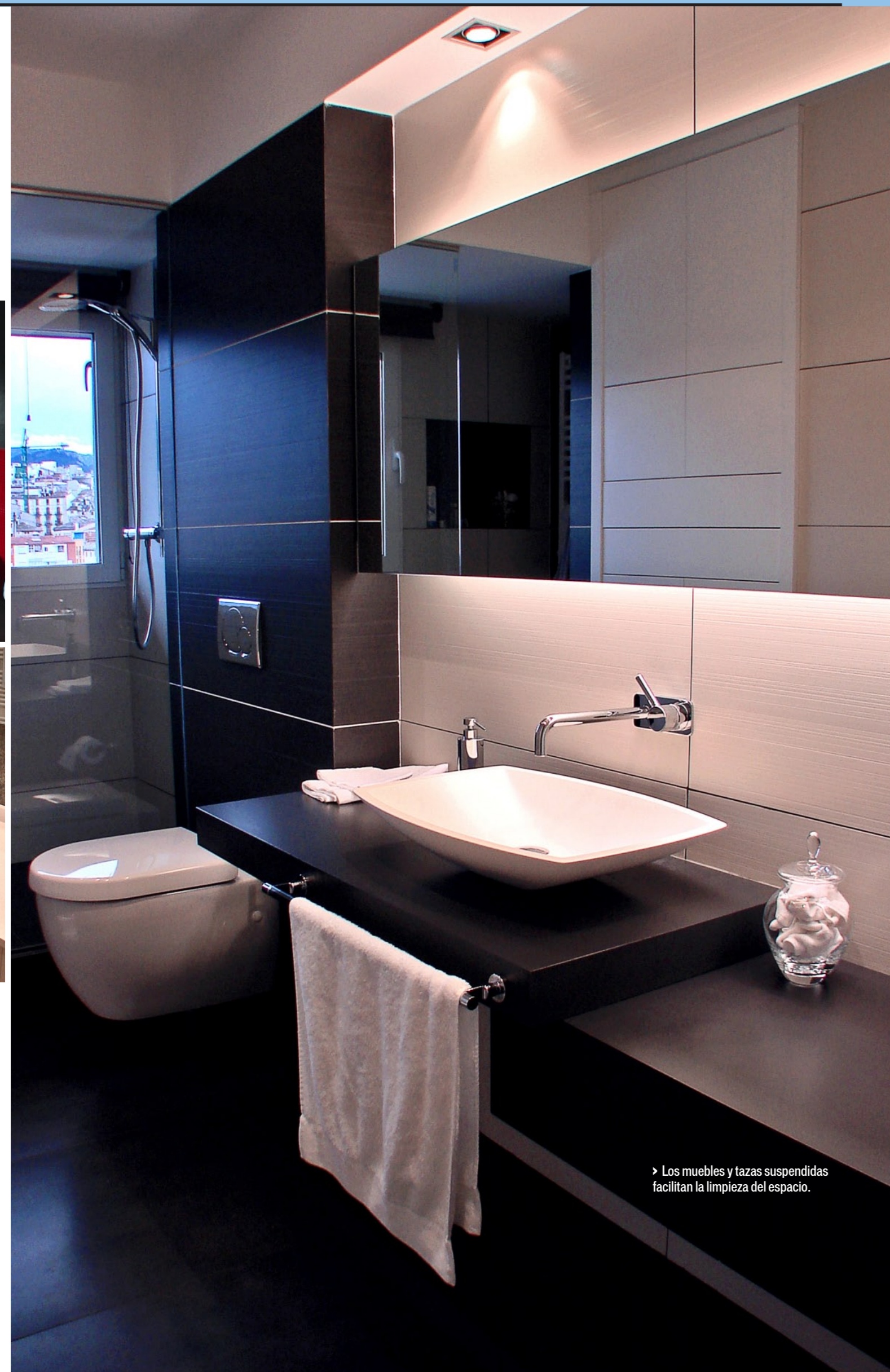
> Los muebles y tazas suspendidas facilitan la limpieza del espacio.