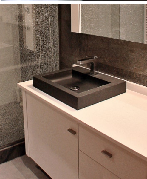
> Los lavamanos sobrepuestos mejoran la estética del baño.